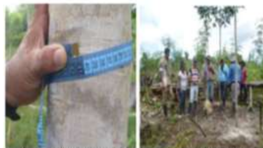
Tema: Caucho-circonferencias de 41 centímetros Lugar: Barrancominas - Guainía Fecha: Enero de 2014 Tema: Caucho – capacitación encajado Lugar: Barrancominas Guainía Fecha: Marzo de 2014

Estos proyectos productivos se han establecido en un área significativa para que exista un mejor aprovechamiento de los recursos naturales. Pese al gran potencial que tienen las siembras establecidas, las comunidades no tienen la capacidad técnica y financiera para realizar las actividades de mantenimiento que se requieren, especialmente en la adquisición de insumos, es por eso que la corporación ha gestionado proyectos encaminados al fortalecimiento de las siembras y de la capacidad técnica de los beneficiarios.