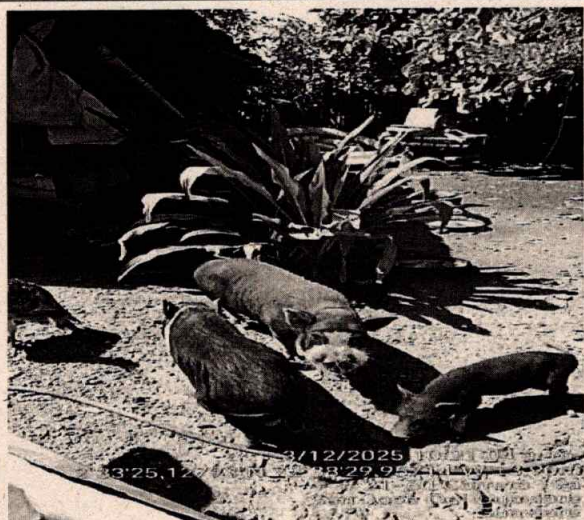
Criadero de Cerdos